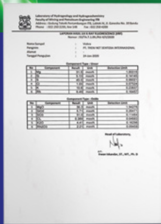
HASIL UJI X-RAY FLUORESCENCE (XRF) Laboratory Of Mining & Petroleum Engineering ITB